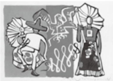
利根山光人「ビバメヒコ」木版

「北上市立利根山光人記念美術館」は、平成7年に利根山彌恵子夫人からアトリエと作品の一部が市に寄贈され、市の芸術文化の拠点とするため平成8年に美術館として開館。28年に開館20周年を迎えました。これを記念し、画伯の功績を讃えるとともに、画伯の志を受け継ぎ、若手芸術家を育成することを目的として「版画作品」の全国公募展を開催します。応募規定は左表のとおりです。詳細は市のホームページをご覧ください。