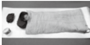
キャンプの必需品 シュラフとキャンプマット