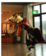
狐面をつけて一人で踊る狐剣舞