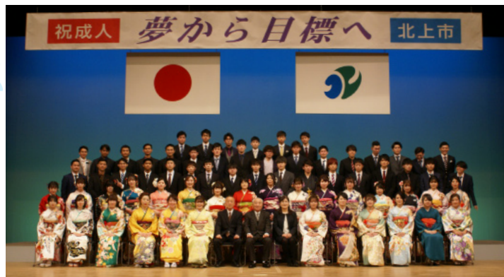
昨年の成人式(記念写真撮影)