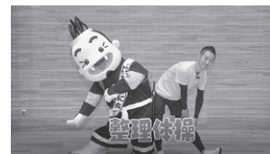
子どもからお年寄りまで取り組める運動です