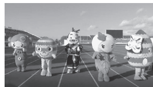
北上にちなんだキャラクターたちが大集合

そこで、自宅で誰でも効果の高い運動を行うことができるように、高知市発祥の体操の北上版として体操動画「きたかみいきいき体操」を制作しました。すでに12月から北上ケーブルテレビで放送しているほか、YouTubeの北上市公式チャンネルでも配信しています。また、グループで取り組むことで楽しく運動を続けることができます。3人以上で定期的に取り組むグループにはDVDを貸し出しますので、希望する場合は長寿介護課まで申し込みください。