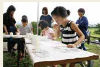
シャボン玉アート

9月1日(土)に体験型イベント『親子秋まつり』を利根山光人記念美術館で行いました。「美術館はキャンバスだ!」と銘打ち、子ども