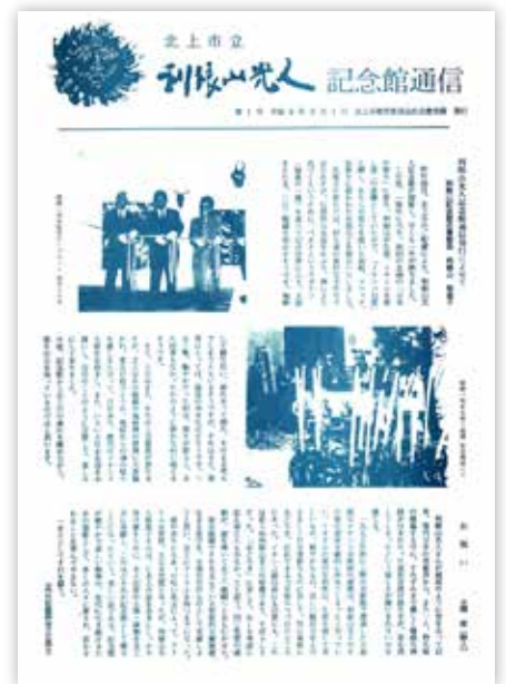
記念すべき第1号(平成9年8月1日発行)

第1号には県立美術館に先駆けて、北上市に美術館が誕生したことの意義、そして利根山画伯と北上市との縁などが書かれております。