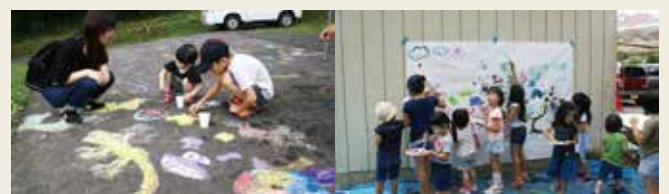
道路にチョークでお絵かき

たちが、模造紙に自由に絵を描いたり、シャボン玉アートをしたり、道路にチョークでお絵かきしたりと秋を感じながら、普段できない体験を楽しんでいました。