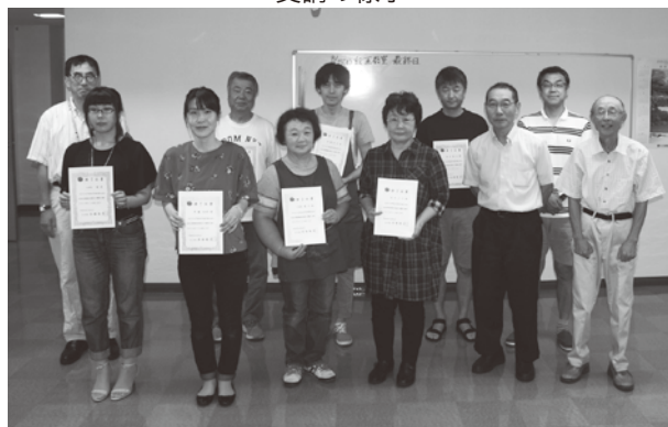
修了式での集合写真