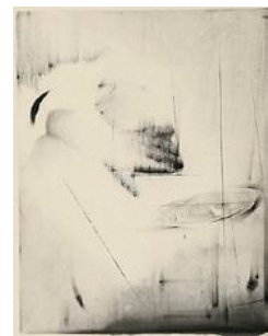
《Under current 2》