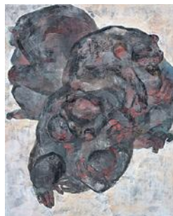
《私たちのだいな何か》