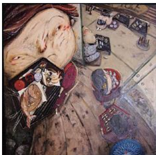
《宴たけなわ、今夜も大忙し！》