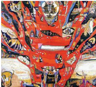
《無意識的精神構築記 “暖かい愛情で潤う生命の樹”》