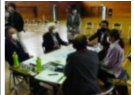
育みたい子どもの姿について語り合っている 参加者のみなさん