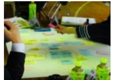
参加者のみなさんが個人で意見を付箋に書き、語り合っています。