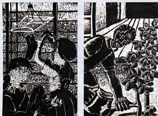
江釣子中学校生徒作品の一例