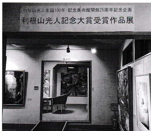
利根山光人生誕100年・記念美術館開館25周年記念企画 利根山光人記念大賞受賞作品展

こうして臨機応変に100周年事業は展開していったが、そのまとめが後期企画展「利根山光人記念美術館のあゆみ展」と「利根山光人記念大賞受賞作品展」の開催である。