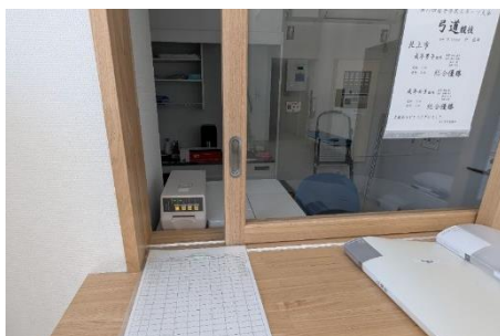
駐車券割引機（管理人室窓口に設置）