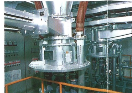
④有害ガス除去装置