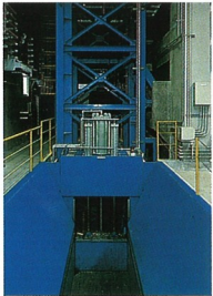
③可燃性粗大ごみ切断機