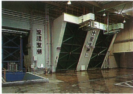
②プラットフォームとごみ投入扉