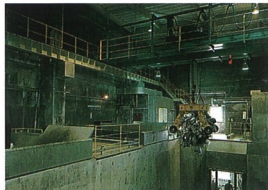
⑤ごみクレーンと投入ホッパ