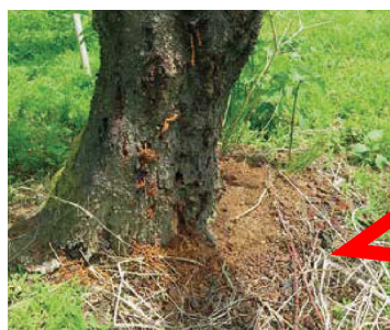
クビアカツヤカミキリのフラス