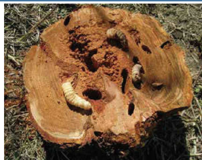
クビアカツヤカミキリの幼虫