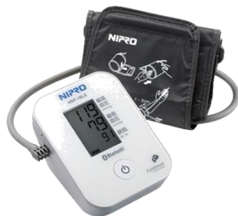
ポータブル血圧計