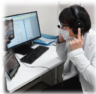
聴診器用PC/ヘッドホン(病院)