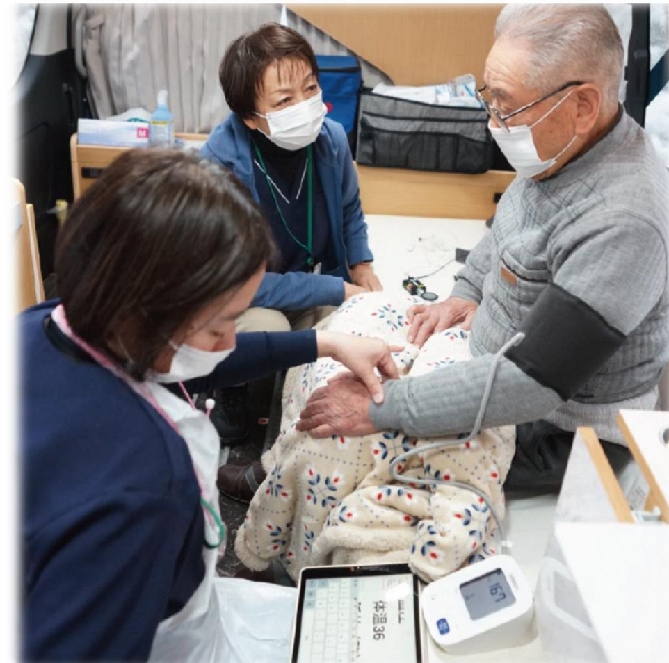
(写真)車内で看護師が血圧を測定する様子