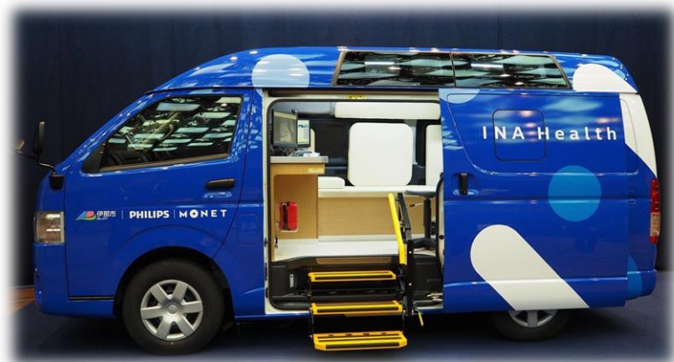
外観イメージ（参考：伊那市導入車両）