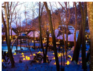
<雪明かりと民俗村の小正月>