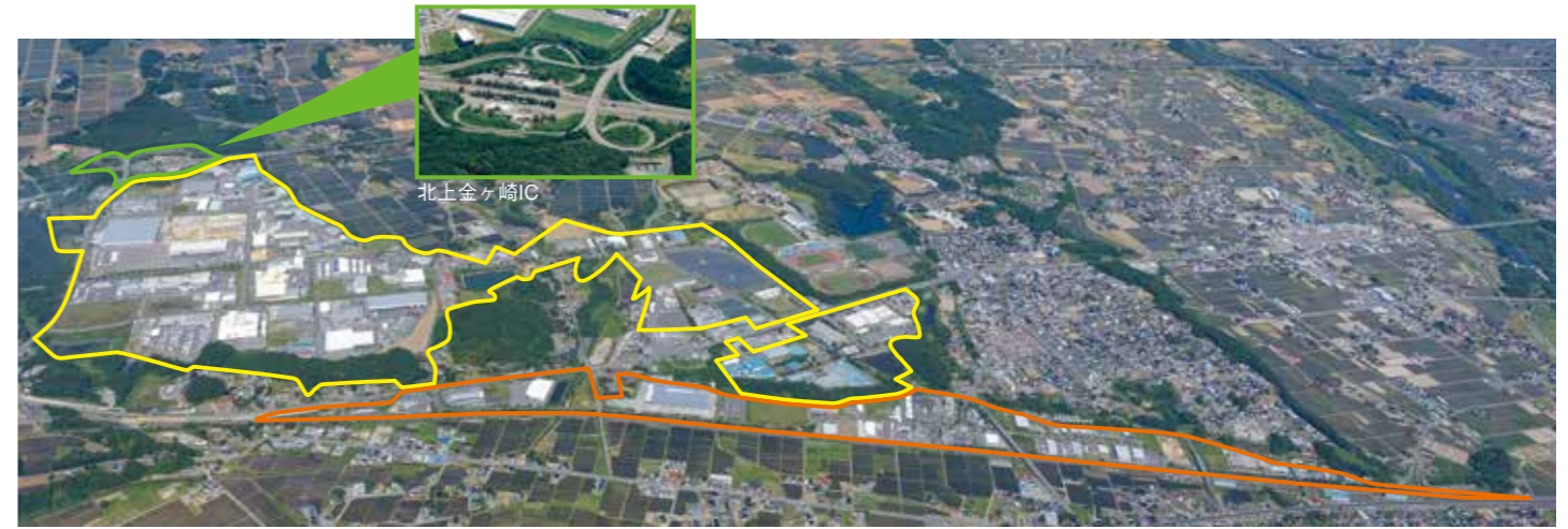
北上南部工業団地 オフィスアルカディア・北上

北上南部工業団地、オフィスアルカディア・北上は、交通基盤等の立地条件に優れており、北上川流域テクノポリスの中核的工業団地、産業業務機能の拠点的団地として期待されている団地です。