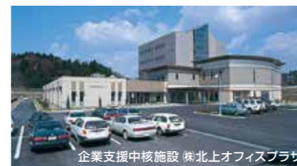
企業支援中核施設 北上オフィスプラザ

交通面では、北上南部工業団地の東側を国道4号線、西側を東北自動車道が南北に走り、また、北上金ヶ崎ICに直結しています。さらに、北上金ヶ崎ICの北方約3kmの地点には秋田自動車道の分岐点となる北上ジャンクションがあり、交通の利便性に富んでいます。