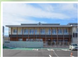
令和4年に新築された笠松小学校