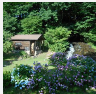
認定No5 親水公園 お滝さん