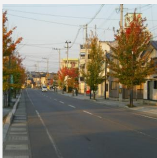
認定No13 本通り カナダカエデ色づく歩道