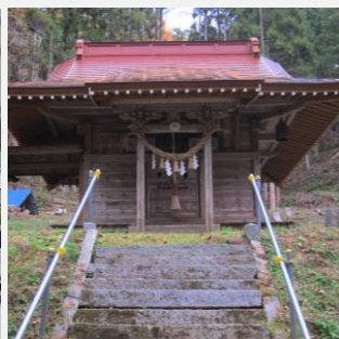
認定No122 荘厳を極める麓山神社