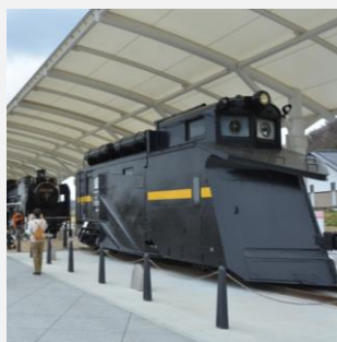
認定No121 出発進行！ 未来へむかう展勝地SL