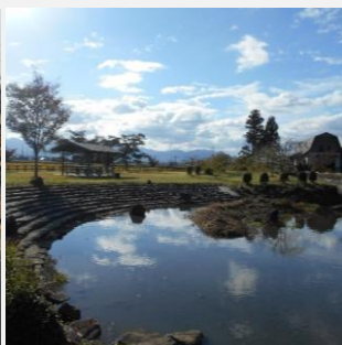
認定No120 鳩岡崎親水公園(ピオトープ)