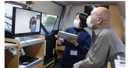
車内での診療の様子