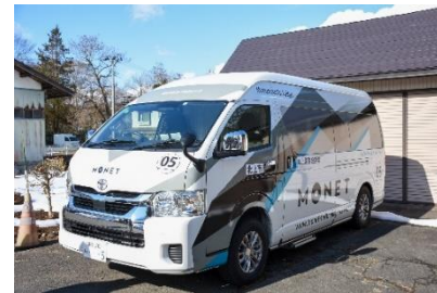
実証実験で使用した車両(ハイエース)