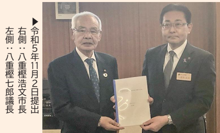
▶令和5年11月2日提出 右側…八重樫浩文市長 左側…八重樫七郎議長