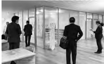
施設内を見学。今後の活用が期待されます

健康づくり課・子育て支援課・子育て世代包括支援センターがワンフロアで仕事をするにより、市民の健康、子育てに関する相談や問題への迅速な対応が可能になりました。1階には検診ホールがあり、5台の検診車を収容できます。また、電源供給設備があるので検診車のエンジンを停止し使用できます。雨でも安心、1回で多くの検診を受けることも可能な構造です。子どもたちの遊び場も備え、雨天でも小さな子どもたちが遊ぶことができます。市民の皆さまが休憩できるオープンスペースもあり、多世代に利用いただける施設でした。