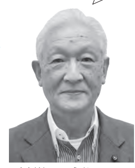
たかはし こうじ 議員 高橋 孝二 YouTube 「高橋議員」