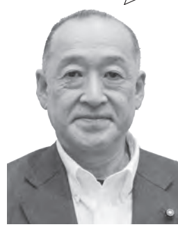
たかはし ひろし 議員 高橋 洋