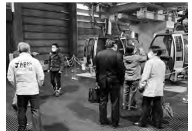
夏油高原スキー場での視察

第1製造棟（K1）は、建屋は完成しているものの、稼働部分はまだ1期分のみで、現在2期分の立ち上げと、3期目の製造装置などの搬入を開始していました。市場の状況を見ながら4期目の搬入を行いたいとのことで、4期目まで立ち上がるとK1がフル稼働となります。2棟目の建設予定地造成は令和3年度末ごろまでの計画で、市場の状況を見ながら建築工事に着手したいとのことでした。