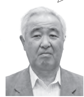
たけだ まさる 議員 武田 勝 YouTube 「武田議員」