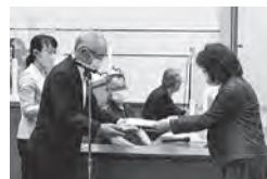
議会モニターの一人一人に委嘱状を交付しました

令和3年度 第1回北上市議会モニター会議を、6月3日に本会議場で開催し、議長から23人に委嘱状を交付しました。