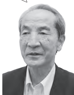
けんじろう 鈴木 健二郎 議員