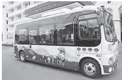
拠点間交通の路線を走っている「おに丸号」