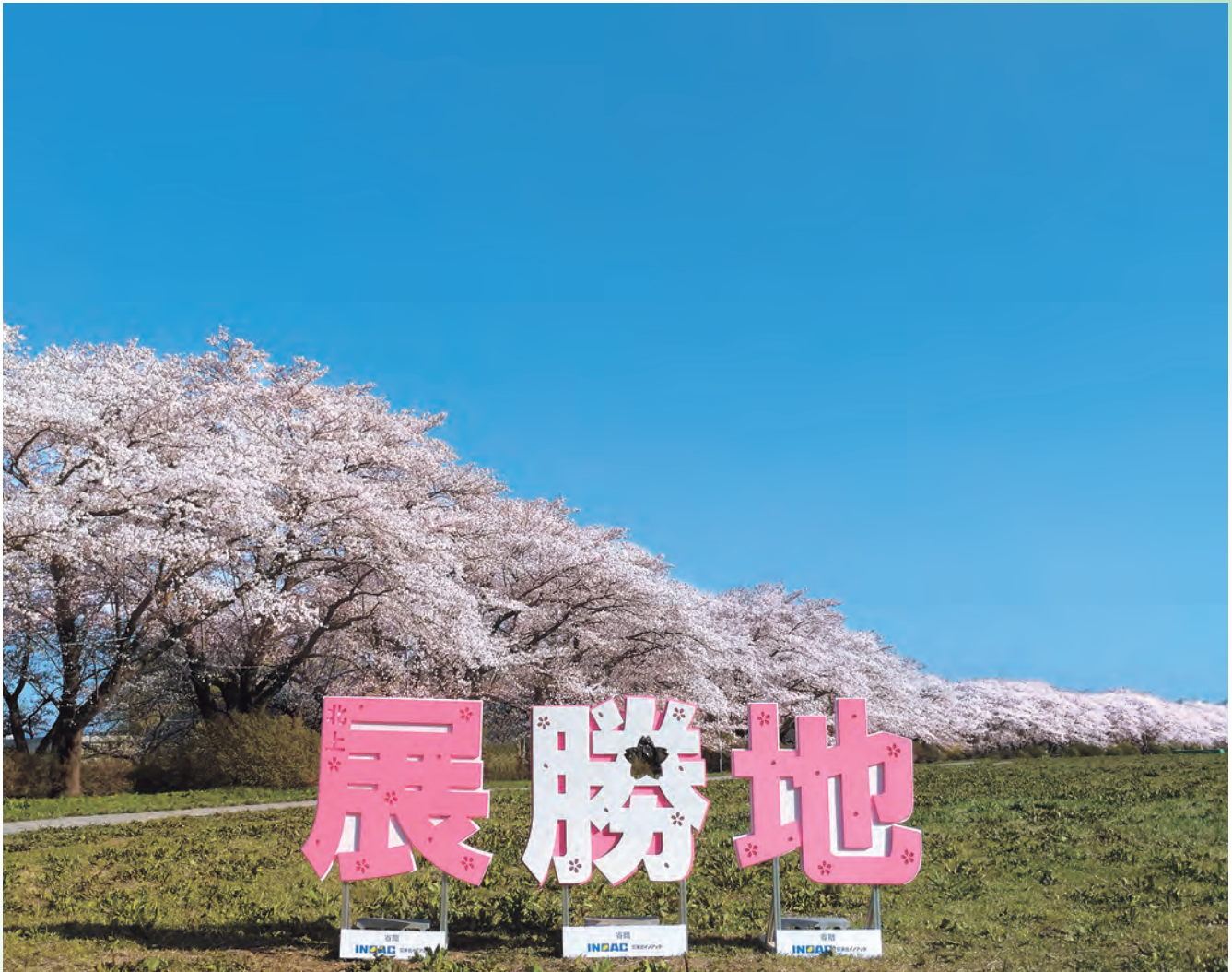
100年を経過し、次の100年に向けたスタートとなる展勝地