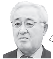
たけだ まさる 武田 勝 議員 YouTube▷