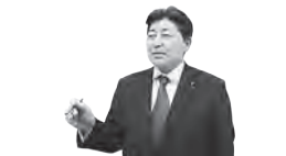
関連質問者 みやけ やすし 三宅 靖 議員