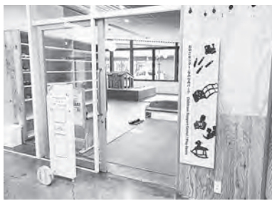
ほっこ（ほっこ）内にある北上市地域子育て支援センター。4月から土曜日も開館しています。

北上市地域子育て支援センターを土曜日も開館するもの。また、屋内遊び場は、日曜日と祝日のみ、小学2年生まで利用可能とする。