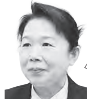
たかはし くみ 高橋 久美子 議員 YouTube▷