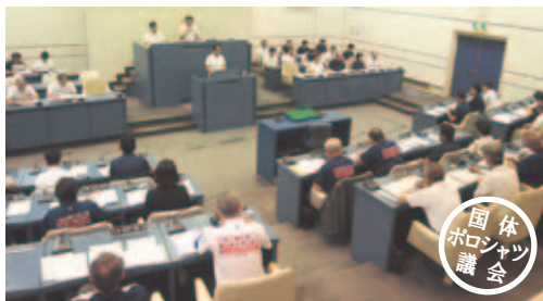
▲国体の機運醸成のため、全議員が公式P Rポロシャツを着用して本会議に臨みました。(6月9日・24日)