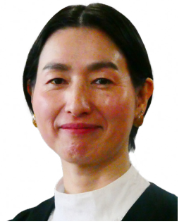
ちだ ゆうこ 千田 優子 議員