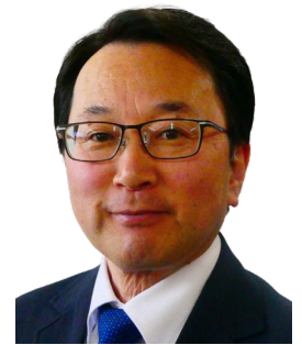
くまがい こうき 熊谷 浩紀 議員