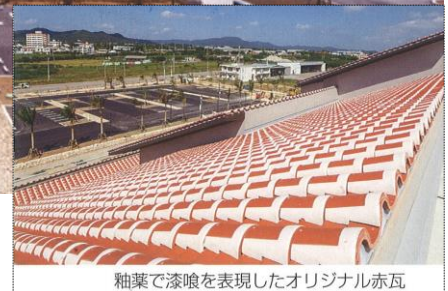
釉薬で漆喰を表現したオリジナル赤瓦

2日目は、いよいよ「第59回石垣島まつり2023」の開会ということで、オープニングセレモ