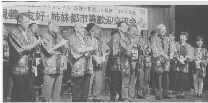
友好都市提携10周年を記念し、石垣島まつりに来島した北上市の人たち。舞台上であいさつする=4日夜、南の美ら花ホテルミヤヒラ