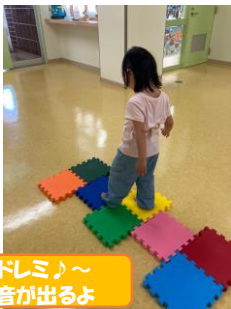
ドレミ♪～音が出るよ

遊びのお部屋は明るく清潔で、手作りおもちゃや絵本、子どもたちが大好きなアンパンマンなどのおもちゃがたくさんあります。月曜日～金曜日に未就学児が利用できます。利用は予約制になっており、市のホームページや、公式ラインから予約できます。保育士が3名常駐しており①10:00～②12:45～③14:30～の各回90分の利用になっています。育児等の相談も安心してできます。