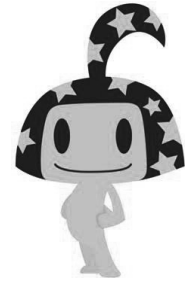
国保イメージキャラクター ハピルスくん

国民健康保険(国保)は皆さんが病気やけがなどをしたときに安心して診察や治療が受けられるようにするための制度です。 国保は、加入者の皆さんに納めていただく国民健康保険税(国保税)と国、県、市の負担金などで賄われています。職場の健康保険や後期高齢者医療制度などに加入している人、生活保護を受けている人を除いて、全ての人が加入します。 引越しや進学などで変更があったときは、忘れずに届け出をしましょう。