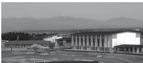
市立いわさき小学校(当社施工)

ISO認証企業としての自負と責任を持ち お客様に満足していただける電気設備を 提供いたします。