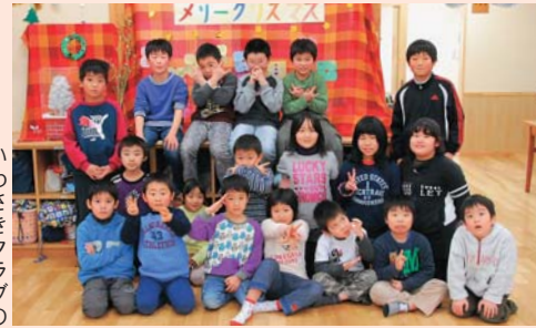
いわさきクラブの 元気な仲間たち

小学生が、放課後や休校日に遊びや勉強で過ごす場所…そこが「学童保育所」(放課後児童クラブ)です。共働きや母子、父子家庭のために、子どもたちが安心して過ごせる場所でもあります。1年生から6年生の異年齢集団は、放課後のきょうだい。「ただいま〜!」「お帰り!」…今日も元気な声が響いています。