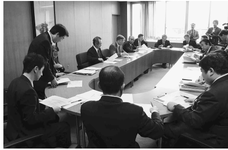
第2回雇用対策本部会議(1月6日)