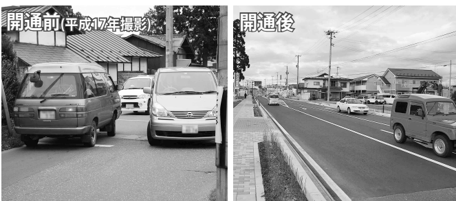
(左)工事着手前の飯豊赤坂線。車がすれ違うのがやっとでした (右)開通後の道路。歩道と右折レーンが整備されています

同路線は国道4号の西側を南北に走る幹線道路で、4月に開院する県立中部病院へのアクセス機能を持つ道路です。整備が完成したのは、北鬼柳地内の市道山田広表線の丁字路から国道107号までの520m。平成17年に事業に着手し、総事業費は8億4100万円です。