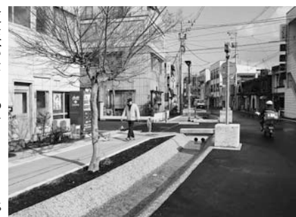
完成を間近に控えたせせらぎ緑道(3月17日)

広瀬川に沿って古くから飲食店が立ち並んでいましたが、昭和60年ごろには生活雑排水が流入し、悪臭が問題となっていました。その後、市街地に下水道が普及することにより、悪臭などは発生しなくなりました。その一方で上流地域の都市化が進み、雨水の流入速度が上昇。洪水被害の危険性が高まっています。