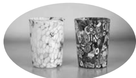
今回の公売に出品予定のベネチアングラス