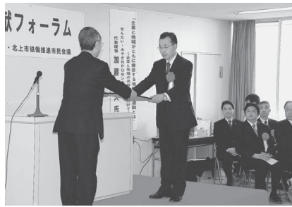
15企業が表彰された地域貢献活動企業功績賞授賞式