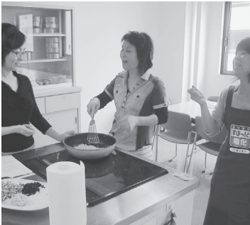
【市民編 1】 「IHクッキングヒーターの特徴と上手な使い方」…IHクッキングヒーターの特徴や上手な使い方について、簡単な調理実演を交えて説明します(下)