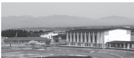
市立いわさき小学校(当社施工)