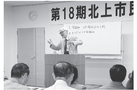
昨年の講義の様子

本年度も北上市民大学を開講します。講座は全部で10講座。幅広い分野から多彩な講師陣をお招きします。学習は一生のもの。学ぶ楽しさを味わいませんか。お好きな講座だけの聴講もできますので、お気軽にご参加ください!