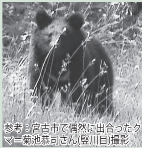
参考：宮古市で偶然に出合ったクマ