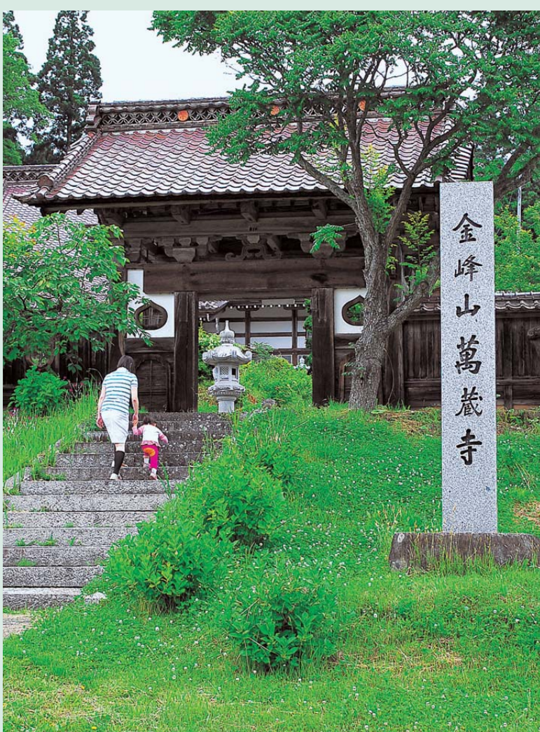
平安時代からの由緒を持つ古寺、幾多の災害に遭いながらも文化財に指定されている数多くの仏像・神像を今に伝えている