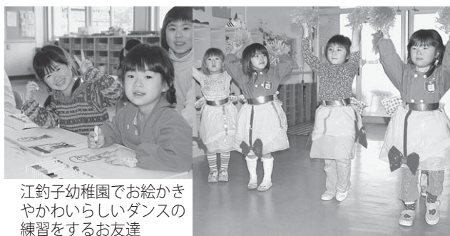
江釣子幼稚園でお絵かきやかわいらしいダンスの練習をするお友達