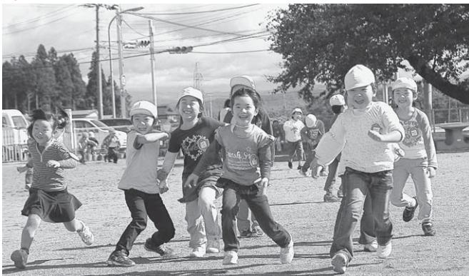
園庭で元気に遊ぶ飯豊保育園のお友達