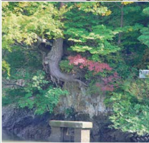
(上)紅葉の見ごろは、例年10月下旬～11月上旬【10月19日撮影】 (左)奥寺堰水門近くにある岩を抱え、雑木と絡み合っている松は「根性の松」と呼ばれている ※山神社周辺は、がけ地になっていますので、注意してください。