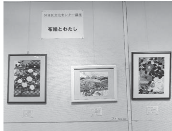
NHK文化センター北上教室の展示