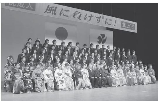
成人を迎えた皆さん(平成21年成人式)