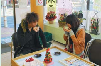
更木桑茶の試飲を開催中

10月24日、中心商店街の一角にオープンした北上特産品ショップ「鬼のゆめ」。みんなの希望と夢を乗せ、キラキラ輝く店を目指し名付けられた。市内の特産品と土産品の紹介や販売をするアンテナショップだ。