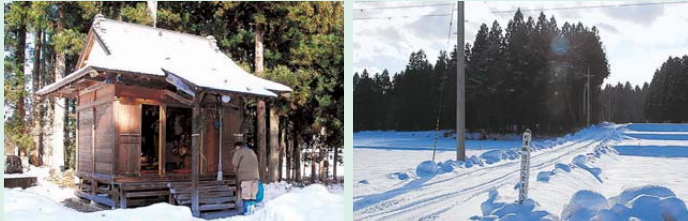
昭和24年に建てられた遊行上人堂(礼拝堂)は、平成11年に地区民の浄財で改築された(左)。林に囲まれて(右)堂は建ち、上人塚は堂の後ろにある

北上市コミュニティバス「奥寺神社前」バス停で下車。道に沿って南東に向かうと、左側に案内柱があり、案内の通りに歩くこと15分。バス停からは約500mほど。林の中に上人塚と礼拝堂がある。