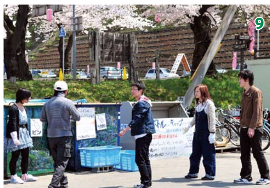
1. 北上川の上を泳ぐこいのぼり 2. 3年ぶりに桜並木の下で披露された黒沢尻歌舞伎によるおいらん道中 3. 幻想的な夜桜のライトアップ 4. 朝日で色づく早朝の桜並木 5. 満開になった5月3日の桜並木 6. 舟着き場付近で泳ぐこいのぼり 7. 老木の幹から咲いている桜 8. 今年からサル回しが登場 9. ペットボトルのフタを回収する活動を行った大学生が中心のecoつくろう隊 10. 散ってゆく桜。来年は展勝地開園90年を迎えます