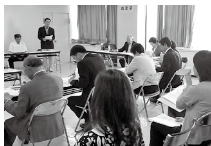
審査会でプレゼンテーションする提案者

この事業は、市や地域が抱える公共的・公益的な課題について、市民公益活動団体などが協働で取り組む事業を支援し、協働のまちづくりを進めるための補助制度です。公開プレゼンテーションでは観覧者が見守る中、同補助金に応募した4団体が自分たちの事業を11人の審査員にアピールしました。