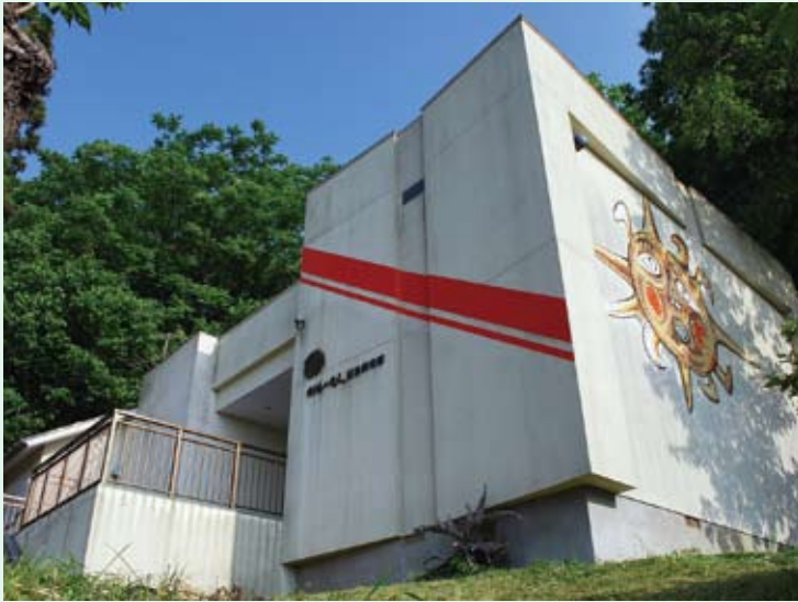
(上)太陽の壁画が印象的な利根山光人記念美術館 (左)中展示室での阿部輝雄展