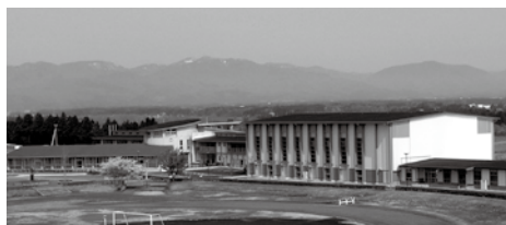
市立いわさき小学校(当社施工)