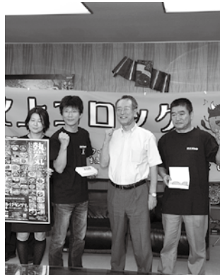
北上調理師会員と伊藤市長

カシライモを使用 B-1グランプリでは販売個数が多いため、二子さといもの株の中心部のカシライモを使用。それをペースト化し、肉をいためてから混ぜ込んでいます。食べるとクリームのようなとろみが強く、甘みとうま味が強く感じます。家庭でも食べられるよう現在、研究中。