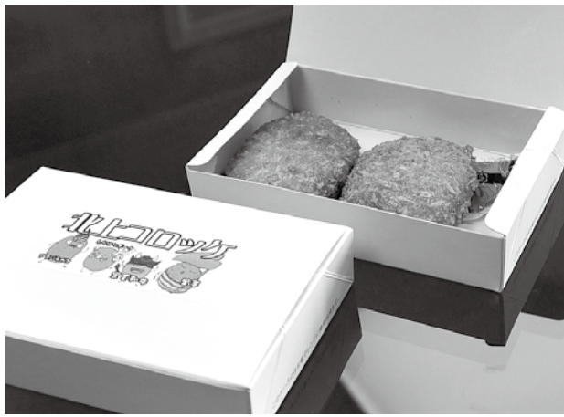
北上コロッケ(1箱2個入り)400円