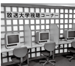
生涯学習センター内の放送大学視聴コーナー

ナーがありますので、どうぞご利用ください。 ●募集期間：23年2月28日(月)まで ●問い合わせ：放送大学岩手学習センター ☎ 019-653-7414