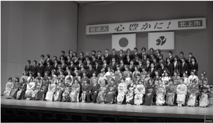
成人を迎えた皆さん(22年成人式の様子)