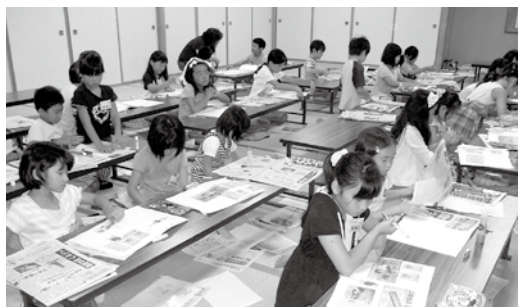
広告や政府広報はどこにあるのかな？真剣にスクラップに取り組み子どもたち