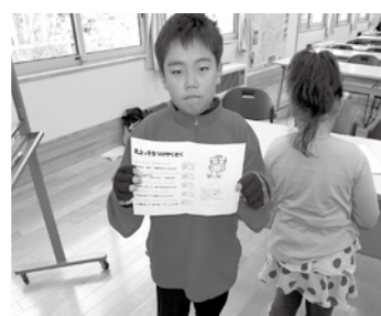
丸が10個になり、カードを提出する児童。「まもれたで賞」は何か？