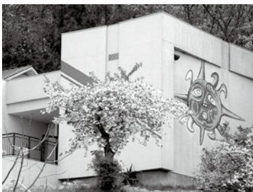
桜が咲くころの美術館。春になったらまたお会いしましょう！