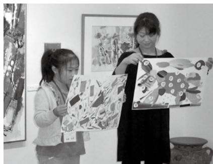
出来上がった作品の題名と感想を親子で発表しました

大人も子どもも心を感じたままを表現する楽しさに触れ、夢中になって作品を仕上げていました。完成した作品は11月14日、15日の「遊・Y・O・U学園祭」に展示され、来場者の目を楽しませました。