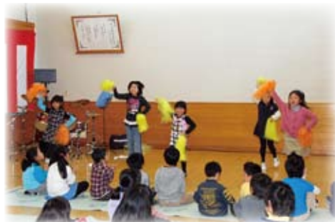
昨年完成した稲瀬学童保育所の開所式での元気なステージ

共働き家庭や母子・父子家庭の小学生が、放課後や休校日に遊びや勉強で過ごす場所が「学童保育所」(放課後児童クラブ)です。