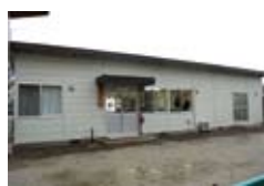
昨年完成したたちばな学童保育所