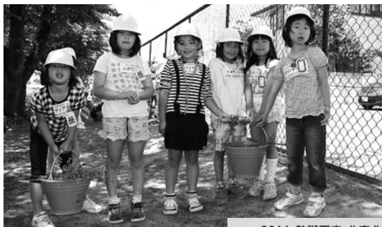
胸にボランティアシールを貼り、美化活動をした黒沢尻北小学校1年生(上)／胸に貼ったボランティアシール(右)