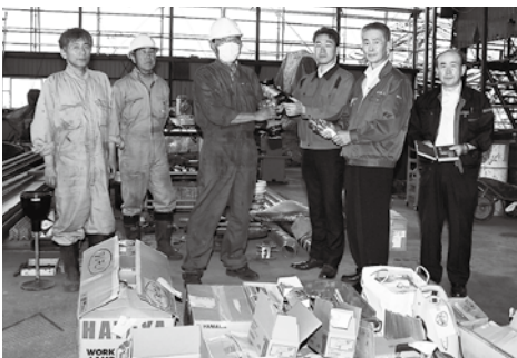
13日、産学官連携グループ「北上ネットワーク・フォーラム」の会員など18社2団体からお預かりした工具・機械類2,058点を釜石市の(株)三陸技研、(有)釜石内燃機(写真)に届けました

○行方不明者は、原則として被災後3カ月間その生死が分からない人 ○兄弟姉妹は条件がありますので、ご相談ください。