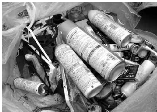
穴を開けずに出されたスプレー缶。爆発事故の原因になります

ここ数カ月間で、ごみ収集車が燃えないごみを収集した時に爆発事故が3件、6月には市清掃事業所の粗大ごみ処理施設で爆発事故が発生しました。