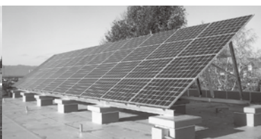
太陽光発電設備(当社施工・岩手大学)