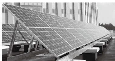
太陽光発電設備(当社施工・岩手中部病院)

(注2)事業規模…営業収益を基本とし、水道、下水道、農業集落排水の各事業では使用料収入のことをいいます。なお、工業団地、宅地造成の各事業では調達した資金規模を示す「資本と負債の合計額」とされています。