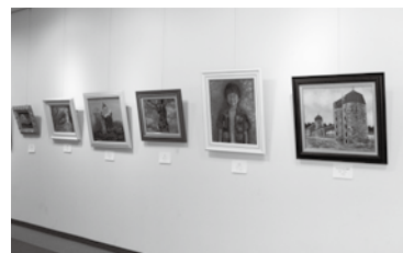
昨年度の「遊・YOU学園祭」(上)作品展示。「光の会」の絵画の数々(左)ミニステージ発表。「黒蜜ドルチェ」による自作の歌