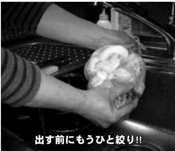
出す前にもうひと絞り!!