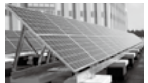
中部病院太陽光発電