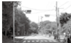
総合運動公園前LED信号機