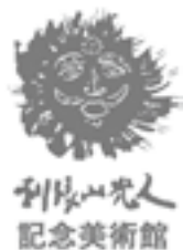
利根山光人 記念美術館