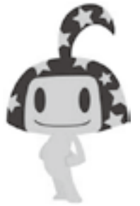
国保イメージキャラクター ハピルスくん

国民健康保険(国保)は皆さんが病気やけがをしたときなどに安心して診察や治療が受けられるよう、お互いに助け合う制度です。国保は、加入者の皆さんに納めていただく国民健康保険税(国保税)と国、県、市の負担金で賄われています。