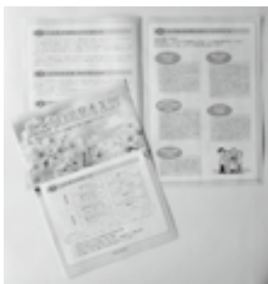
市自治基本条例のパフレット

自治基本条例を施行 市は、1月1日から自治基本条例を施行しました。 この条例は、まちづくりの基本理念や仕組み、行政の在り方など、まちづくりのシステムやルールを定めたもので、昨年の市議会6月定例会で可決されました。 また、自治基本条例に基づき協働のまちづくりを進めるために、地域づくり組織条例および市まちづくり協働推進条例が市議会12月定例会で可決されました。