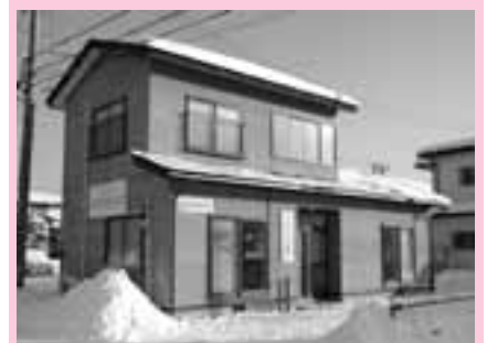
「北上市びょうごじほいくしつ」の看板が目印です