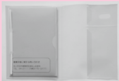
(A5ファイルになっているカバー)